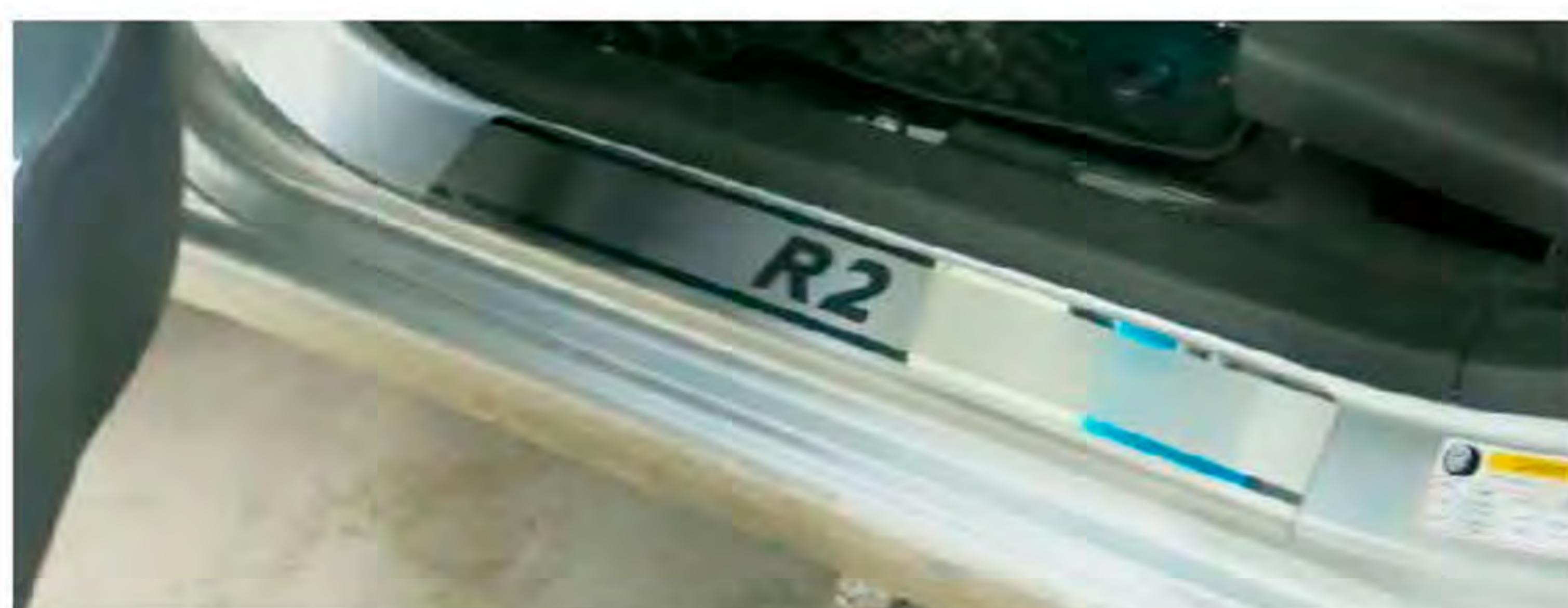
Фото установленной накладки

Накладки на остальные пороги устанавливаются аналогичным образом.