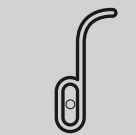
Выталкиватель для замены батарейки