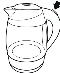
Рисунок – 4

— Включите чайник, нажав кнопку (переведя выключатель в положение 1).