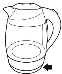
Рисунок – 3

— Наполните чайник холодной водой, следите за метками.