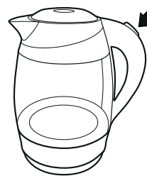
Рисунок – 5

— Перед снятием с базы убедитесь в том, что чайник выключен (переключатель в положении 0).