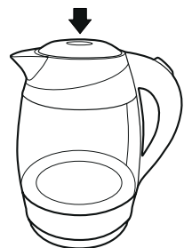
Рисунок – 1