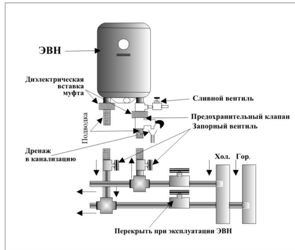
Рис. 2. Схема подключения ЭВН к водопроводу

7.3. При соблюдении правил установки, эксплуатации и технического обслуживания ЭВН и соответствии качества используемой воды действующим стандартам изготовитель устанавливает на него срок службы 5 лет.