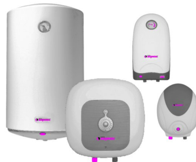
Рис.1. Внешний вид ЭВН

Водонагреватель оборудован штатным сетевым шнуром электропитания с вилкой. Электрическая розетка должна иметь контакт заземления с подведенным к нему проводом заземления и располагаться в месте, защищенном от влаги, или удовлетворять требованиям по влаго- и брызгозащищенности.